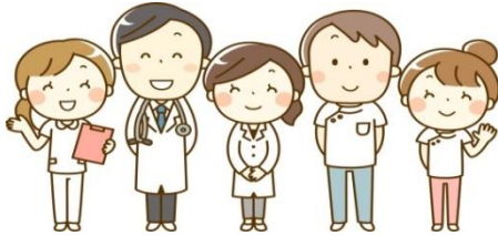
1.跨專業團隊整合照護