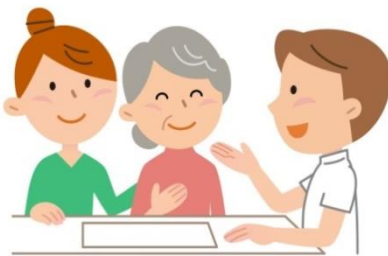
5.後續居家照護及技巧指導

結語：復健運動是為了預防關節僵硬、肌肉軟弱無力及減少依賴照顧的機會，但對失能的病人及照顧者來說是一項長期抗戰，希望你可以持續、努力，共勉之~