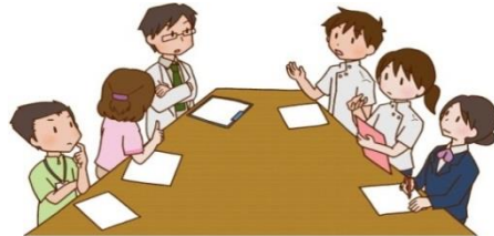
2.定期評估調整治療