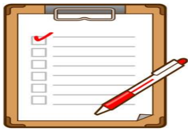
3.擬定個人化治療計劃